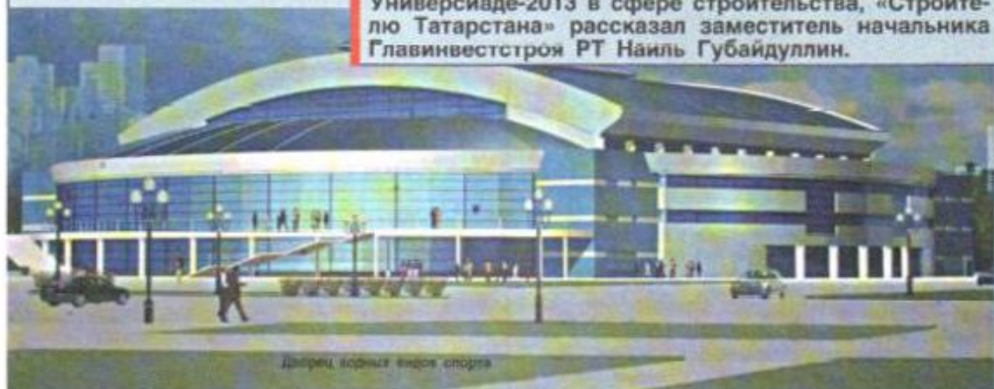
Дворец водных видов спорта